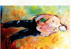
pinhead hazels hips