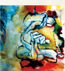
group im bad