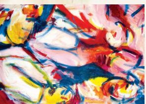
orgie mit hund